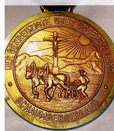
Medaillen mit religiösen Motiven sind auch dabei.

• Die Ausstellung ist bis Ende April geöffnet. Der Eintritt ist frei.